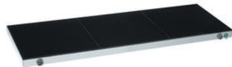
Placas quentes em vitro-cerâmica para diferentes temperaturas