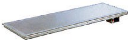
Placas quentes em aço inox