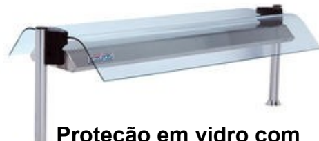
Proteção em vidro com luz e infra-vermelhos